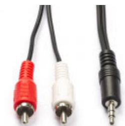
Nr 1 Tulplug na Speaker nr 1

xlr kabel van microfoon ontvanger hierin en de andere kant in de microfoon ontvanger → Deze uiteinde kant na Laptop Nr 1 →